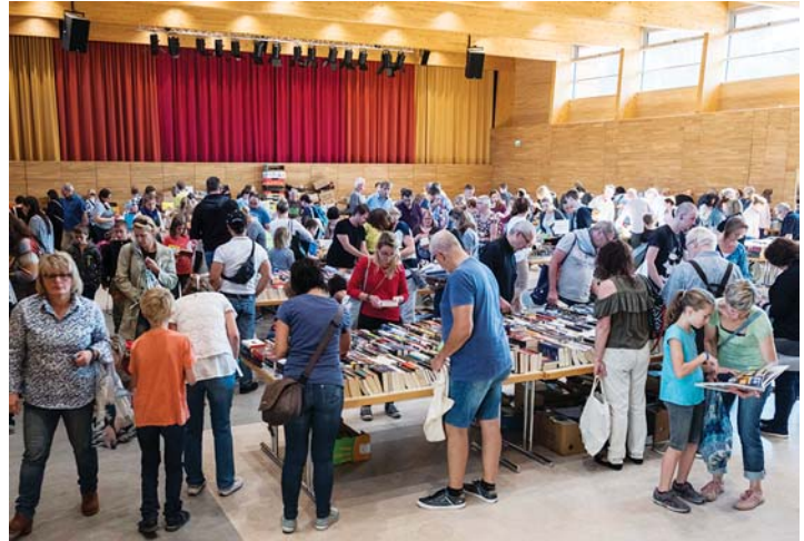
Eine Fülle von Büchern, Spielen, Zeitschriften und CDs erwartet die Besucherinnen und Besucher des großen Büchermarktes am kommenden Samstag, 12. Oktober, von 13 bis 16 Uhr in der neuen Stadthalle in Engen.

Weitere Informationen in der Stadtbibliothek Engen, Hauptstraße 8, Tel. 07733/501839, und über den Kontakt des Fördervereins unter www.foerderverein-stabi-engen.de .